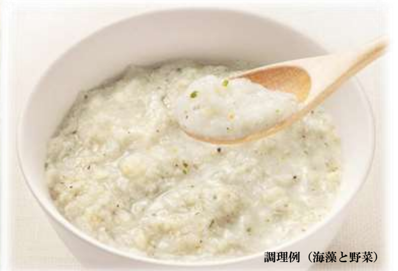
調理例 (海藻と野菜)

明治40年の創業より、米加工ひとすじ107年。 米どころ新潟で、ベビーフードシリーズ、介護食、災害食、健康食などの 各種米加工製品を手がけています。 「食」に様々なニーズが求められている現代。 私達の使命は「安心・栄養・おいしさ」をお届けすることです。